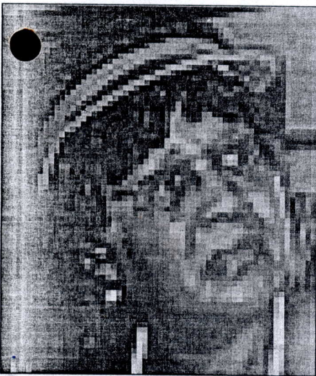
Gayletha Brown, ambassadeur des USA près le Bénin