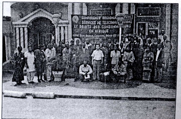
Photo de famille des participants de la rencontre de Cotonou

Le Réseau Afrique des Associations de Consommateurs des Tic travaillera à relever beaucoup de défis en ce qui concerne les droits des consommateurs et les services de télécommunications en Afrique. Les efforts ne seront point ménagés, vu l'engagement sincère des associations de consommateurs à la cause. Cette position a été réellement affichée par la Déclaration de Cotonou signée par toutes les associations de consommateurs participantes. La conférence de Cotonou aura été la conjugaison des efforts des associations de consommateurs dans une vision commune pour faire intégrer, protéger et faire respecter les droits des consommateurs dans le secteur des Télécommunications en Afrique.