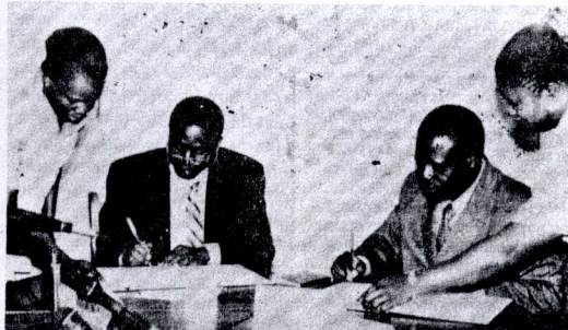
Les directeurs du CBDD et de l'INRAB lors de la signature du contrat