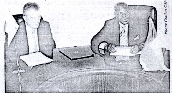
Un appui budgétaire à l'importance avérée

Pendant quatre jours, les consultations ont porté sur le cadre stratégique futur de la coopération bénino-danoise. A cet effet, il est prévu l'augmentation de l'enveloppe de coopération sur les années à venir. Les actions à mener consistent à focaliser la coopération sur un nombre plus réduit de domaines d'intervention ; explorer l'option d'un renforcement de la coopération dans les domaines de développement économique rural présentant un potentiel de croissance, avec un accent particulier sur la création d'emplois dans le secteur privé ; et à voir la possibilité d'un renforcement de la coopération dans le secteur de l'éducation avec un accent éventuel sur l'alphabétisation et l'éducation technique. D'autres domaines ont été identifiés comme la bonne gouvernance, les droits de l'Homme, la démocratie, la société civile et la lutte contre la corruption. Carsten Nilas Pedersen, directeur général de la coopération bilatérale, chef de la délégation danoise s'est dit « impressionné par l'évolution démocratique paisible vécue et dont les dernières élections tenues en 2006 et 2007 sont