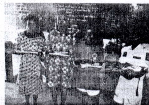
La promotion de la scolarisation passe par l'encouragement des meilleurs écoliers