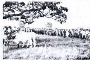
Dans le cadre d'une vulgarisation agricole, remise de boeufs et de matériel d'attelage aux populations