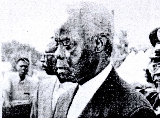
Les consommateurs vont présenter au Général Mathieu Kérékou l'héritage économique qu'il laisse à son peuple après près de 30 ans de règne.

26 octobre 2005, Cotonou va bouger. Les consommateurs béninois fatigués de la morosité de la vie, de la cherté de celle-ci vont descendre dans les rues de la capitale économique pour exprimer aux dirigeants leur ras-le-bol. Tout ceci à travers une marche pacifique. Ils vont présenter au Général Mathieu Kérékou l'héritage économique qu'il laisse à son peuple après près de 30 ans de règne. En effet, de la place de l'Etoile rouge au ministère chargé de la Planification et du Développement en passant par le Boulevard du Canada, la mosquée de Cadjehoun, l'église Bon Pasteur et la place du Souvenir, ils manifesteront leur mécontentement contre les dirigeants du pays vu le fait que la vie est trop cher. Ils vont dénoncer la paupérisation de plus en plus croissante de la grande masse, la faiblesse du pouvoir d'achat du consommateur et la souffrance économique traumatisante qui perdure. Ainsi, voudraient-ils à travers cette marche susciter un sursaut national en vue d'amener les autorités du Bénin à se pencher sur leur situation sociale critique après avoir