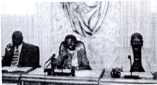
Les représentants du syndicat des pharmaciens