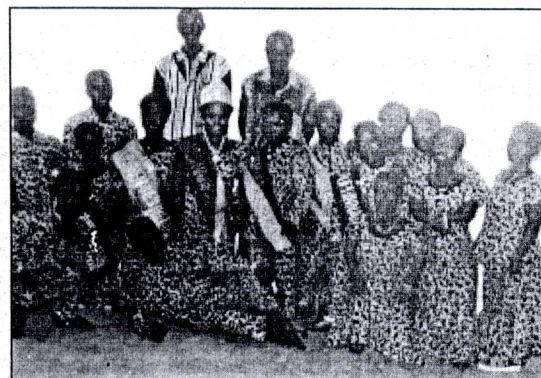
Cette couche sociale a besoin de vos soutiens

Organisé par «J-s diffusion» de Coffi Sévinou, la 2 e édition du concours miss naine et mister nain aura lieu le 23 août prochain.